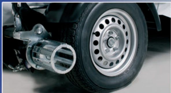
Ajolaite vakiona – käyttö yksinkertaista.