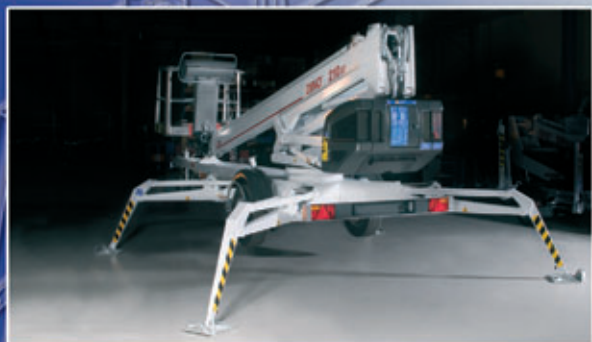
Erikoisrakenteiset niveltukijalat – suuri maavara.