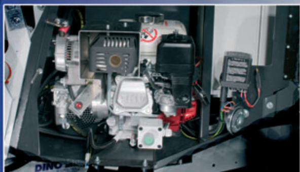
Bensiiniaggregaatti vakiona – käyttövoimaa nostimelle myös ilman verkkovirtaa.